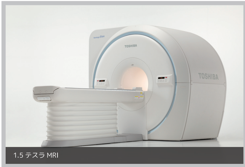
1.5 テスラ MRI