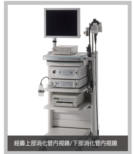
経鼻上部消化管内視鏡/下部消化管内視鏡